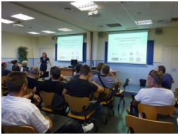
Fotografia de la formació a la Guàrdia Urbana